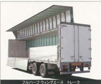
フルハーフウイングエース トレーラ

日本フルハーフは小型温度管理車用バンボディのGVW(車両総重量)5トン未満クラス軽量ボディを追加し、6月2日より発売しました。2007年6月2日以降の普通免許取得者が運転できるのはGVW5トン未満の車両までです。今後のドライバードライブのため、また省燃費運行のため、このクラスの車両の軽量化を図りました。 軽量化は、GVW5t未満で積載量(トーン)を確保する車両範囲が拡大されています。 また、軽量化と併せて熱性能劣化防止や環境対策にも配慮し、リヤドアやサイドドアの芯材(芯材)を強化など、各部で木材レス化を図っています。