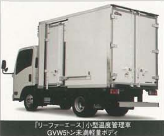
「リーファアーエース」小型温度管理車 GVW5t未満軽量ボディ

日本フルハーフは小型温度管理車用バンボディのGVW(車両総重量)5トン未満クラス軽量ボディを追加し、6月2日より発売しました。2007年6月2日以降の普通免許取得者が運転できるのはGVW5トン未満の車両までです。今後のドライバードライブのため、また省燃費運行のため、このクラスの車両の軽量化を図りました。 軽量化は、GVW5t未満で積載量(トーン)を確保する車両範囲が拡大されています。 また、軽量化と併せて熱性能劣化防止や環境対策にも配慮し、リヤドアやサイドドアの芯材(芯材)を強化など、各部で木材レス化を図っています。