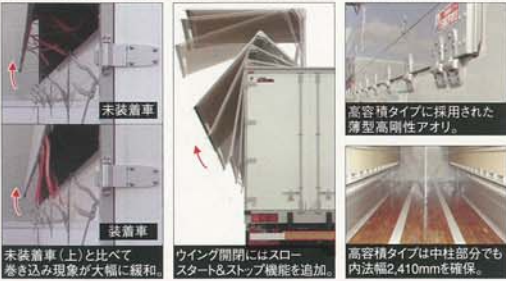
未装着車 (上) と比べて巻き込み現象が大幅に緩和。

日本フルハーフは、このたび、新型ウイングトレーラ「フルハーフ ウイングエース トレーラ」を改良し、6月16日より全国一斉に発売を開始しました。 日本の運輸部門は、CO 2 削減対策の一環として、さらなるトラック輸送の効率化、車両の大型化、トレーラ化が求められています。そうした時代の要求を背景にして、アルミウイングトレーラのパイオニアである当社はウイングトレーラの改良に取り組み、高容積陸送・高品質輸送時代の対応を図りました。 〈主な変更点〉 ●高容積タイプの追加…中柱の突起が無いフラットな薄型高剛性アオリ